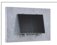
用膨胀螺栓安装在墙上