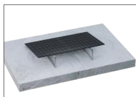
通过膨胀螺栓安装在混凝土屋顶上