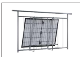
安装在带有弯曲钩子的阳台上